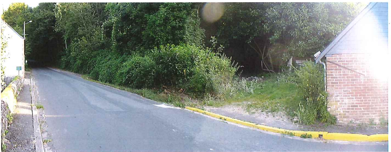
⑫ vue du domaine depuis la sortie du village (lieu dit le Broutier), en contrebas.