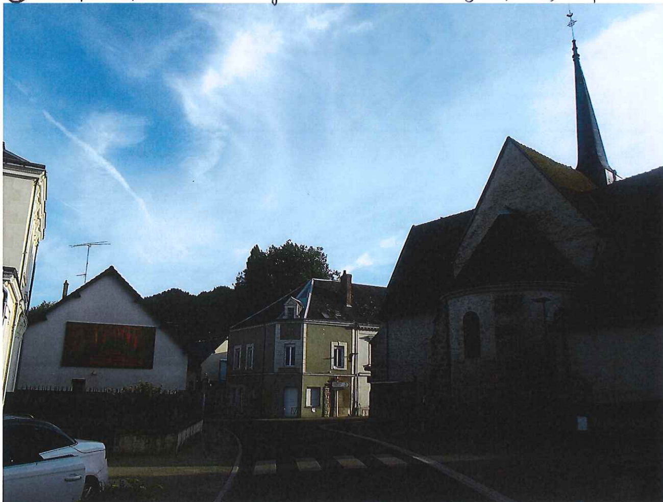
⑫ Vue depuis le Nord de l'arrière de l'Eglise (centre bourg) et du domaine boisé de Beauregard en arrière plan.