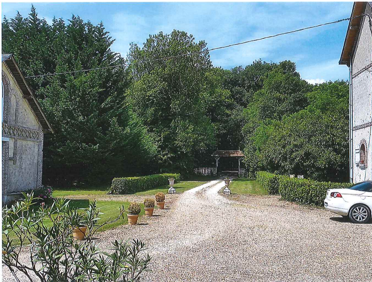
③ L'allée vers la herminière et l'accès depuis la route (vue depuis le château).