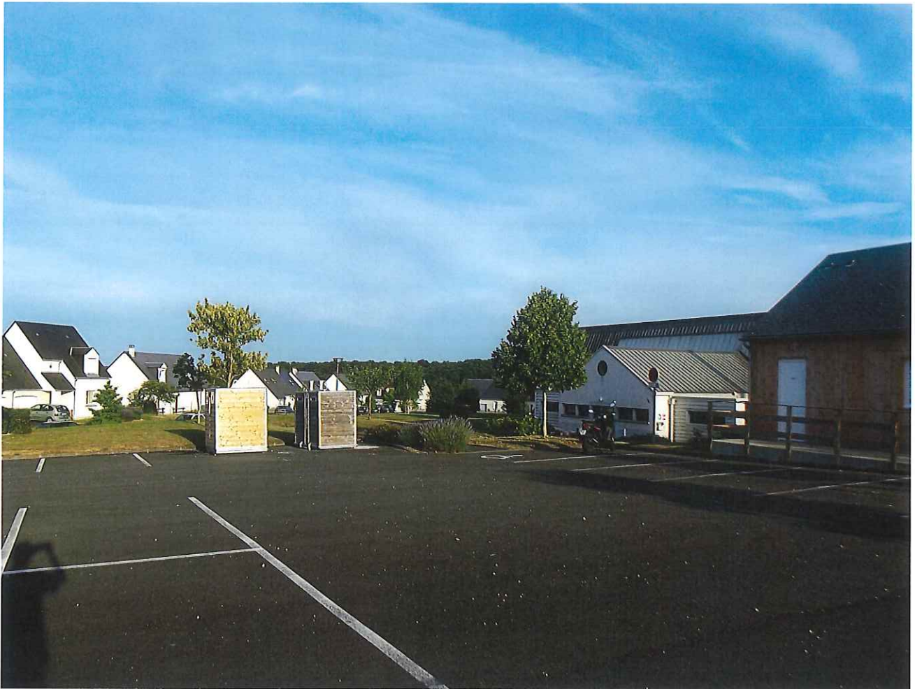
⑭ Vue du domaine de Beuregard depuis le terrain de sport et gymnase au point haut, au Nord de Villemorier - (le Sûcher, le Perré, etc...)