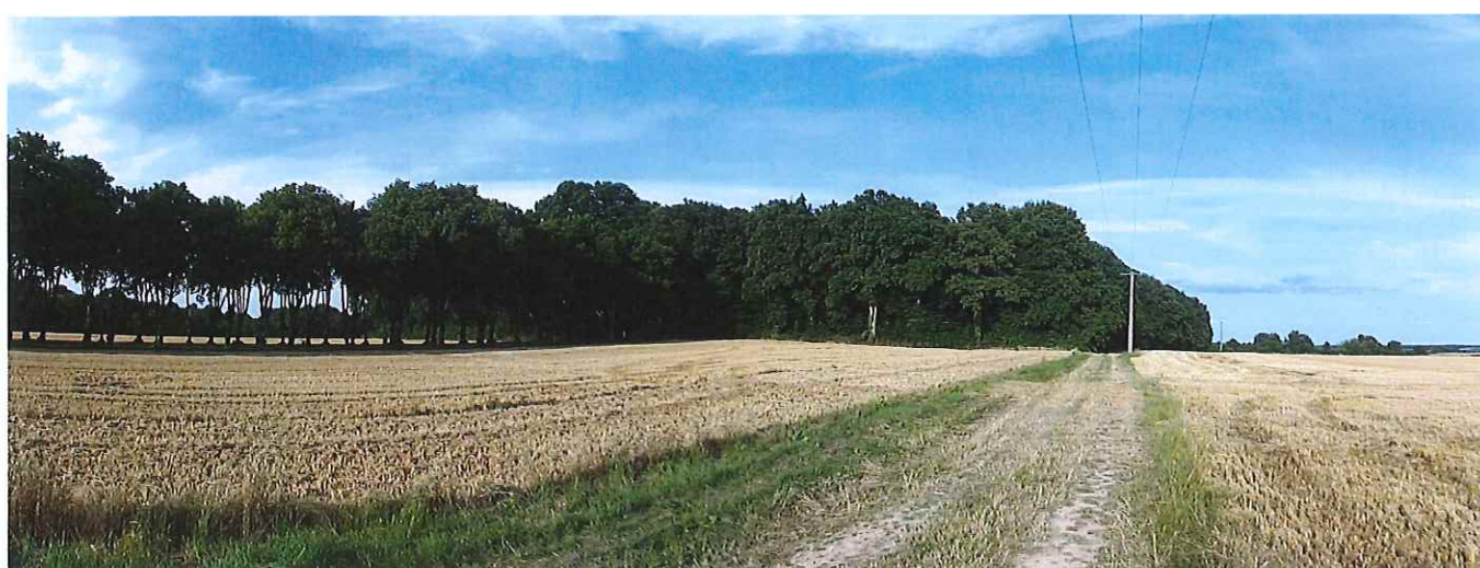
⑤ Vue depuis l'ouest sur le chemin rural qui longe le domaine de Beaugregard - (à gauche l'allée arborée menant au château).