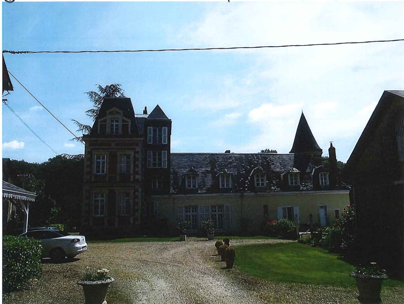
② le château et la cour d'honneur.