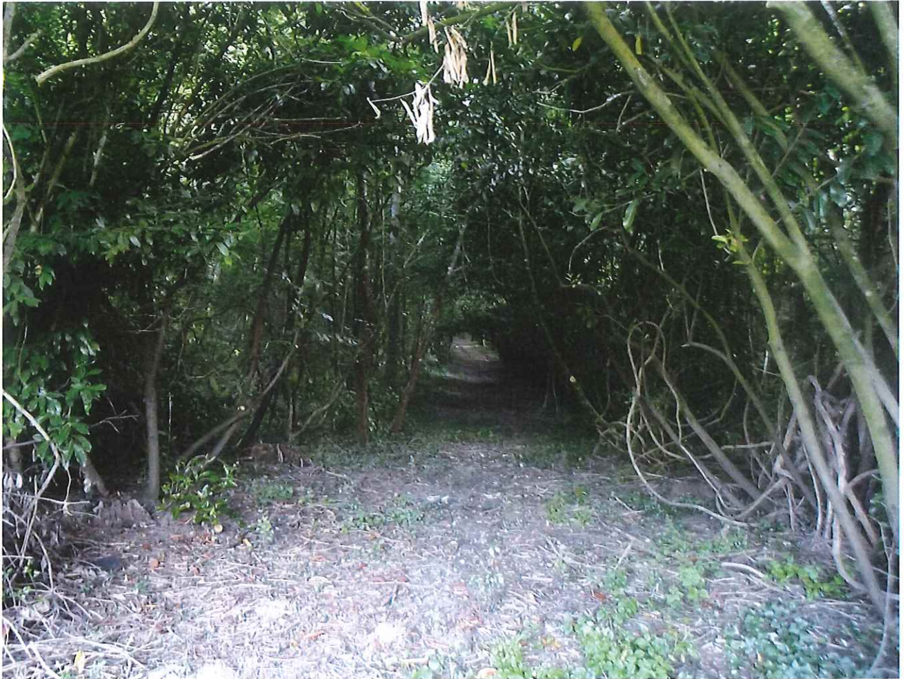
⑬ vue de l'allée "piétonne" qui grince dans le bois jusqu'au château de Beauregard depuis le bourg de Villedomer (au Nord Est, "Le Broutier")