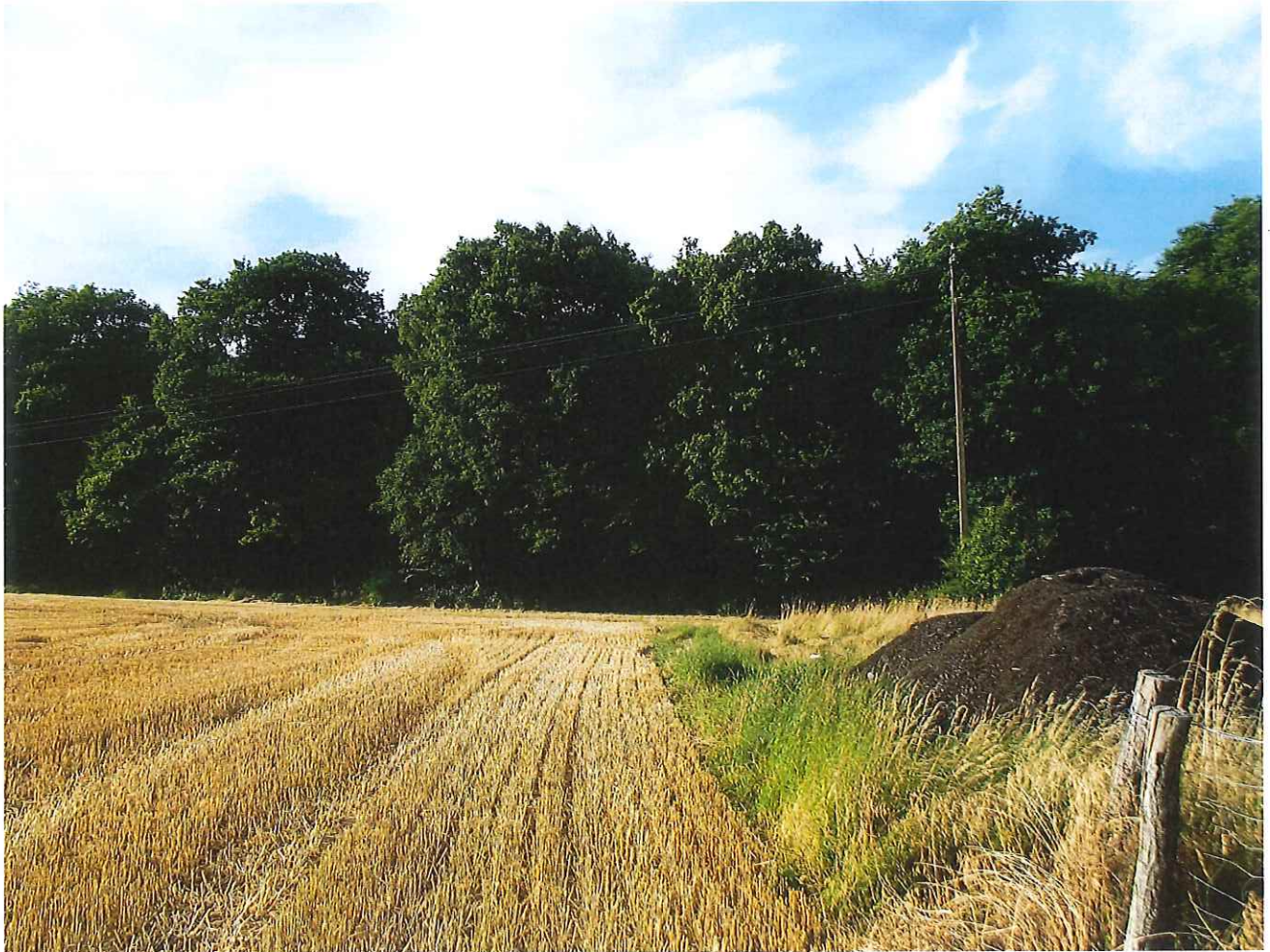
⑦ vue rapprochée depuis les champs au sud.