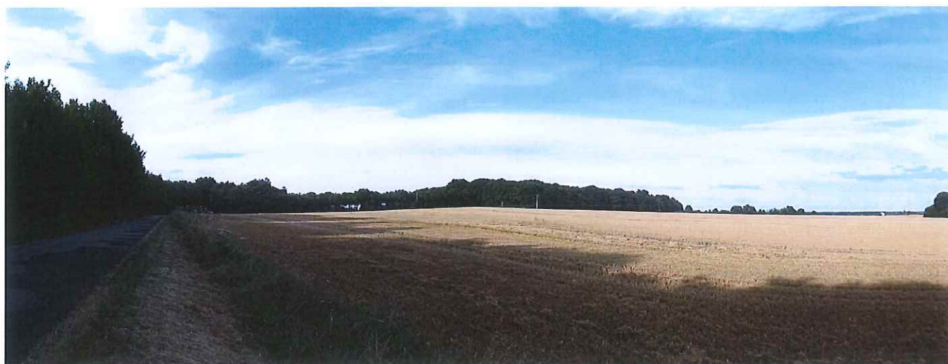
④ vue depuis la route, depuis le sud, sur le domaine de Beaugregard.