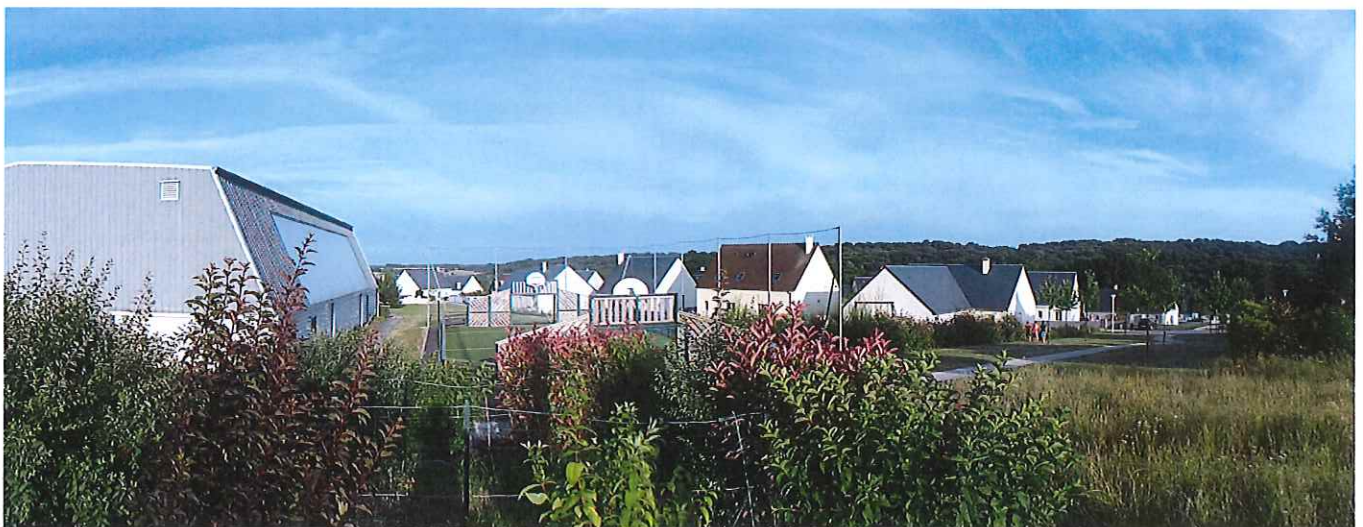
⑮ Vue du domaine de Beuregard, golf, au delà des maisons, depuis le terrain de sport au Nord, de l'autre côté de la vallée du Madelon - Bâtiments et château "invisibles". Un aménagement camping (tentes, caravanes...) serait "invisible" au fond des bois -