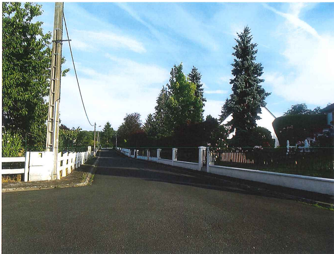
⑪ Vue depuis la partie Nord du bourg : Le domaine de Beauregard, boisé, au fond