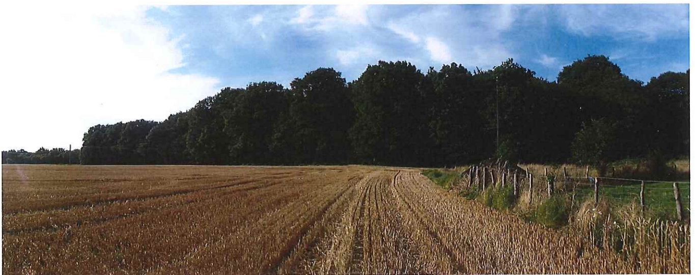
⑥ vue éloignée depuis les champs au sud - Bâtiments "invisibles" - L'aménagement "camping" envidé (tentes, caravanes...) serait également "invisible" car dissimulé par la végétation.